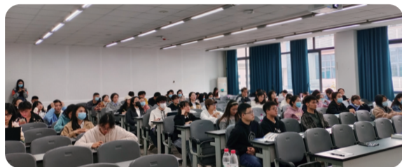
10月14日 四川农业大学（成都校区）宣讲会现场图

经过前期的入校准备、线上线下宣传、拜访各学院老师等筹备工作，整个活动气氛融洽，进展顺利，达到了预期目的。据统计，14日，四川农业大学宣讲会到场学生约七十余名；18日，西南大学宣讲会到场学生一百余名，两场宣讲会现场共收到简历五十余份；20日，浙江大学招聘会收到简历十五份，其中有八名博士生同学投递。目前，所有简历正按部就班地进行面试对接中。