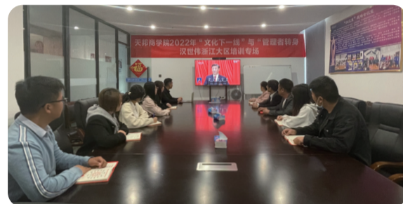
汉世伟浙江大区人员观看党的二十大开幕式