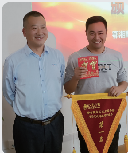
月度批次结算排名第一名 东乡服务部