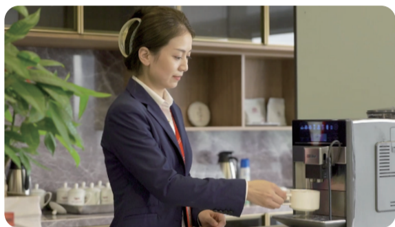
天邦员工日常工作的微记录视频

借助企业宣传片、宣传手册以及天邦人拍摄的优秀短视频，同学们更好地了解天邦近年来的发展历程，真正地感受到了天邦“以奋斗者为本”的企业文化，同时，同学们对展现天邦人日常工作内容的视频表现出了强烈的兴趣。