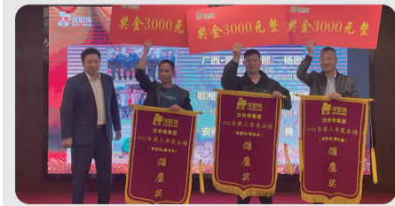
育肥场/服务部—雄鹰奖： 广西大区-灵山服务部 鄂湘赣大区-咸宁服务部 安徽大区-百善服务部