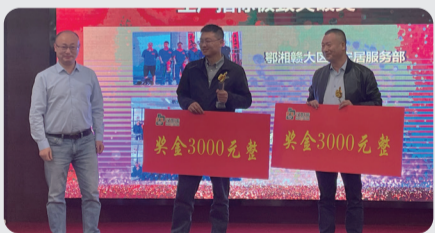
生产指标极致突破奖 鄂湘赣大区-安居服务部 秦河大区-泰安三场