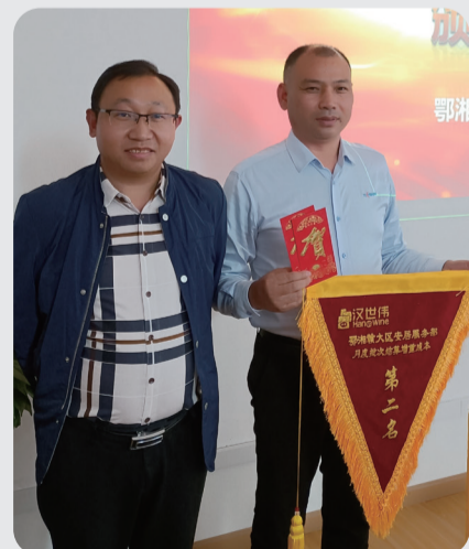
月度批次结算排名第二名 安居服务部