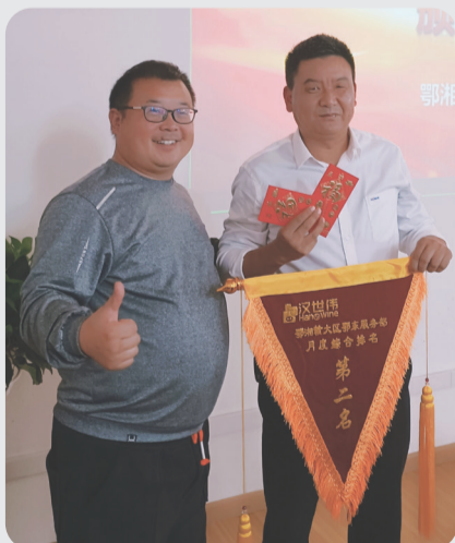
月度综合排名第二名 鄂东服务部