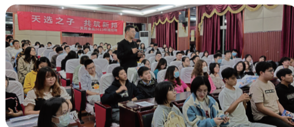
10月18日 西南大学（荣昌校区）宣讲会现场

天邦食品通过十月招聘行程，向三所知名院校的优秀学子展示了不同方向、不同领域的优质岗位，加深了天邦食品对于校园群体的吸引力和影响力，提升了品牌影响力和感召力。同时，校园招聘会的成功举办也标志着校企合作进入了更深层面和全新的阶段。未来，天邦食品将继续携手高校，进一步扩大合作，实现校企产学研深度融合。