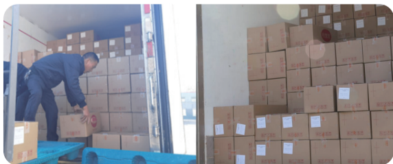
首批飘香鲜肉包闪速发货

当日清晨，260箱包子统一从江苏扬州“闪电配送”，从产品分拣打包，装车交付，再到物流配送，每个环节的工作人员都在与时间赛跑。截至上午，天邦飘香鲜肉包已抵达淮安盱眙、南京浦口、安徽蚌埠工厂食堂。夜晚8点，260箱飘香鲜肉包全部配送完毕，各路物流十分给力！