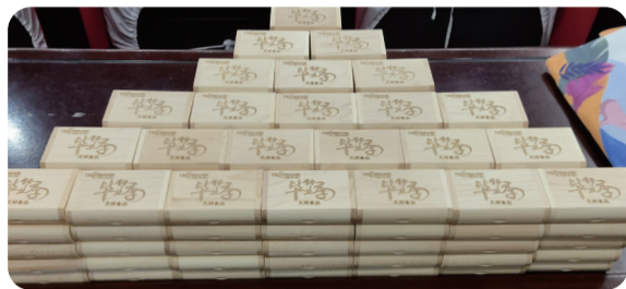
精美的天邦定制礼包

为打造雇主品牌，加深各高校学子对天邦的认识和了解，每场宣讲会，校招团队都为到场同学准备了精美的天邦定制U盘一份，也为积极参与现场互动问答的同学送上一份天邦的定制礼包。