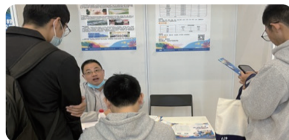
10月20日 浙江大学校友企业专场招聘会现场