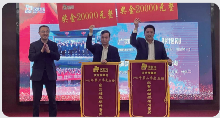
存栏规模增量奖 能繁母猪存栏规模增量奖：广西大区 商品猪存栏规模增量奖：秦河大区