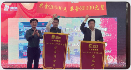
成本极致奖 广西大区 鄂湘赣大区