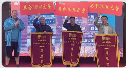
母猪场-雄鹰奖： 广西大区-云表二场 浙江大区-江南二场 鄂湘赣大区-新辉二场