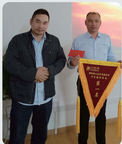
月度综合排名第一名 安居服务部