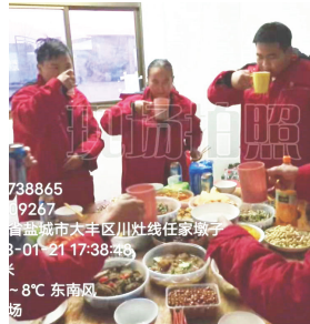
江苏大区-大客户部