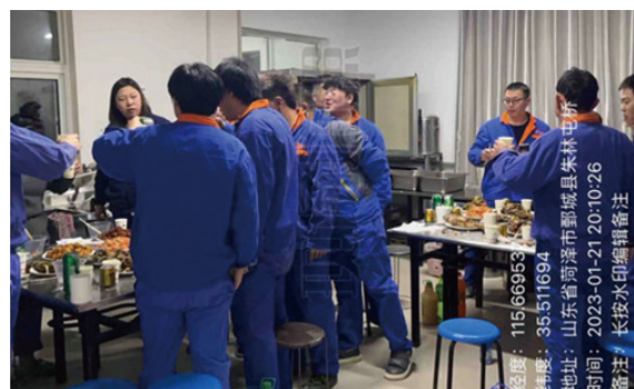
山东大区-菏泽六场