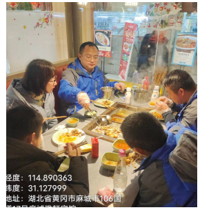
江南道大区-麻城服务部