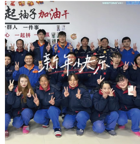
江苏大区-扬州二场