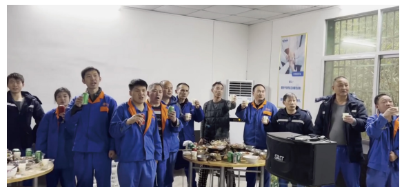
江南道大区-平江母猪场