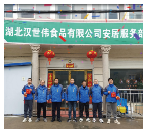
江南道大区-安居服务部