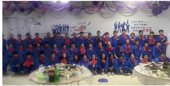
江苏大区-扬州一场