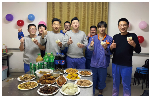
山东大区-菏泽八场