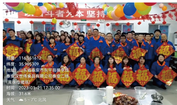
山东大区-泰安二场