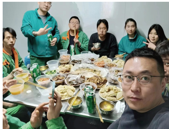
山东大区-菏泽七场