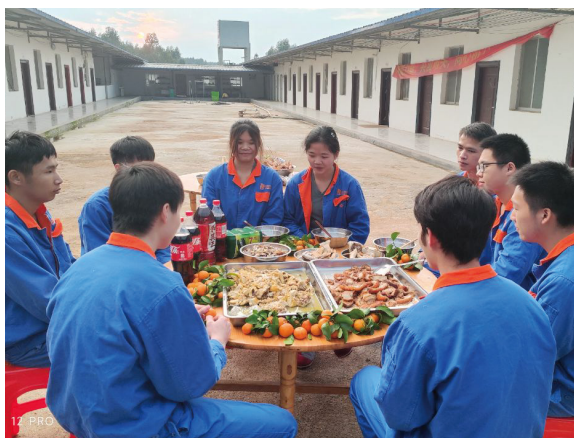
广西大区-宏源育肥场