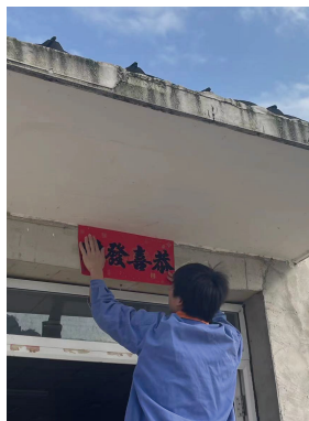
广西大区-元金二场