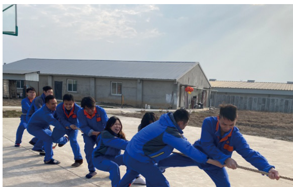
安徽大区-繁昌母猪场