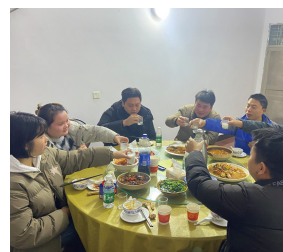
江南道大区-东乡服务部