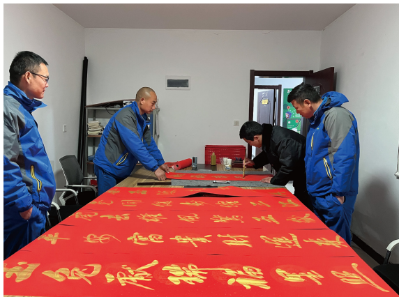
安徽大区-公桥猪场