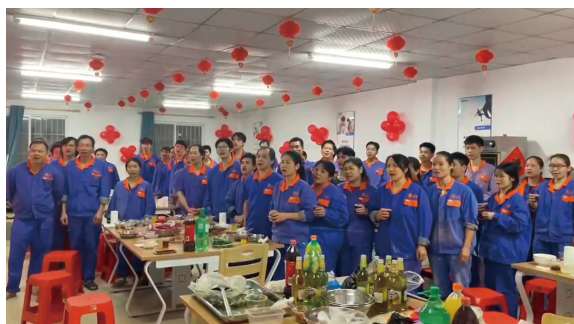
广西大区-元金一场