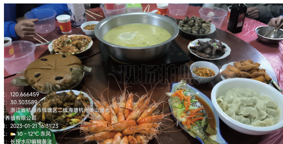
江南道大区-江南场