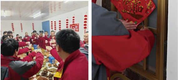
江苏大区-新东方一场