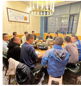
江南道大区-鄂东服务部