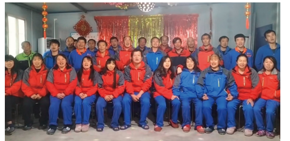
江南道大区-广水新辉一场