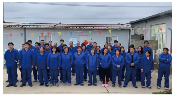
江南道大区-宁海场