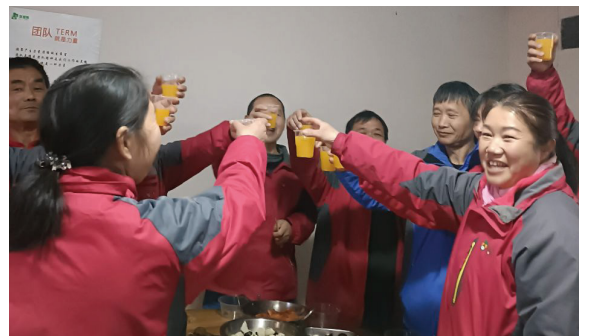
江南道大区-黄石和通场