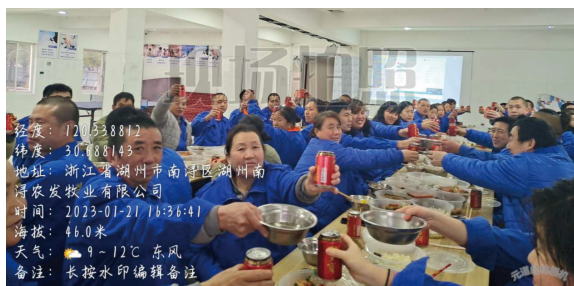
江南道大区-南浔场