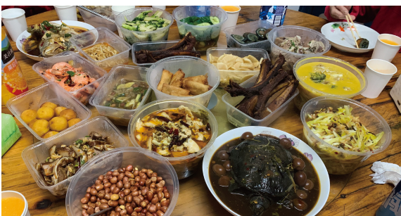
江苏大区-大丰一场