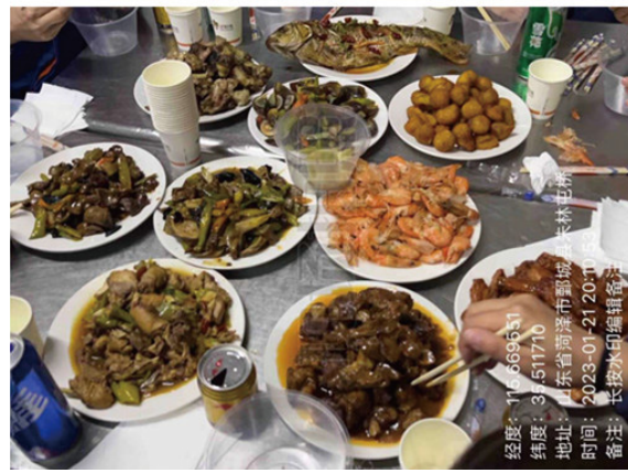
山东大区-菏泽六场