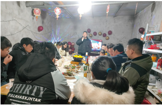
江苏大区-方强服务部